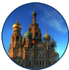
Храм «Спас на Крови»

ул.Садовая, 2 (метро - "Гостиный двор", "Невский проспект") Телефон для справок - 595-42- 48